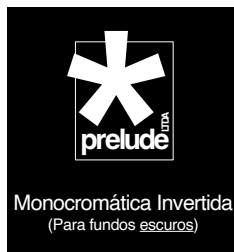
Monocromática Invertida (Para fundos escuros)